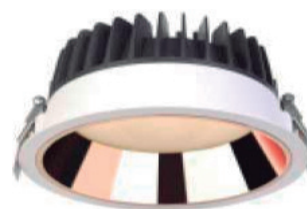
RD Aluminio oro rosa. Rose gold aluminium.