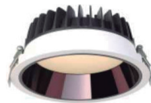
RN Aluminio negro brillo. Bright black aluminium.