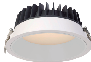
RB Aluminio blanco. White aluminium.