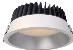
RM Aluminio mate. Matt aluminium.