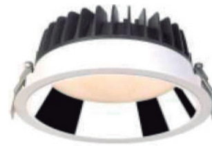
RA Aluminio brillo. Polished aluminium.